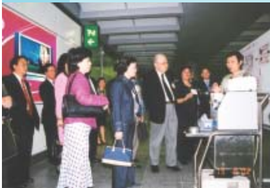
图表 7.5 太平绅士参观香港海关

7.9 在本报告年度内，我们为太平绅士安排了四次参观活动，其中一次是参观渠务署的昂船洲污水处理厂，两次是参观香港海关机场科，另一次是参观食物环境卫生署的公共卫生化验中心。参加者一致认为这些活动很有用，使他们更了解政府各部门的工作。