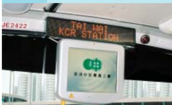
图表 7.2 在巴士上宣传本署的服务

7.3 其他宣传活动包括印制海报和单张、举行巡回展览、在巴士上播放宣传短片，以及在铁路沿线各车站和车厢的电子资讯板介绍本署的工作。在二零零二年九月至十一月期间，本署配合搬迁新办事处展开宣传，目