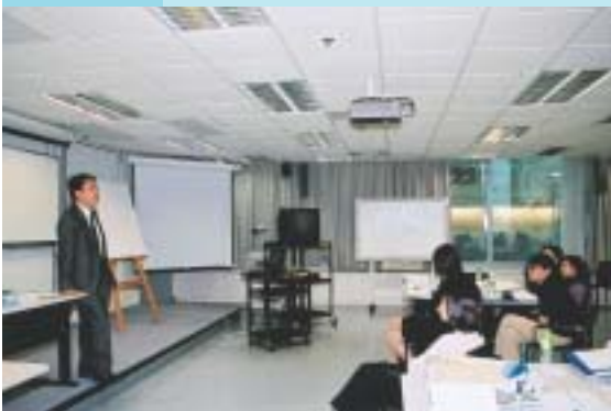
本署人员向政府行政主任简介本署工作