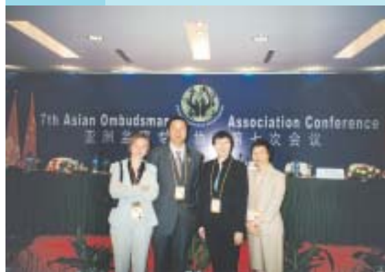
申诉专员出席第七届亚洲申诉专员协会会议