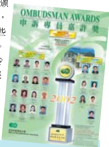
图表 7.7 2002 年得奖机构一览

7.13 公营机构奖 —— 为表扬公营机构以正面和积极的态度处理投诉，以及他们在处理投诉工作上的专业水平，本署于一九九七年七月设立申诉专员嘉许奖。我们会根据被投诉的机构如何处理由本署转介的投诉个案，以及如何致力提高服务质素（包括如何落实申诉专员的建议等），选出值得嘉许的机构。本署每年颁发这个奖项一次，借此公开表扬那些开明问责的机构。一直以来，申诉专员嘉许奖计划深获公营机构及广大市民好评。